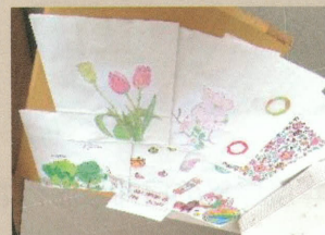
利用者お手製紙袋も好評販売中！