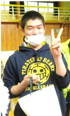
スポーツ大会 入賞しました！

そして、祖父母や両親、病院等々の二十三年人生の中でお世話になった人たちに、少しずつ恩返しをしていきたいと心から思っています。