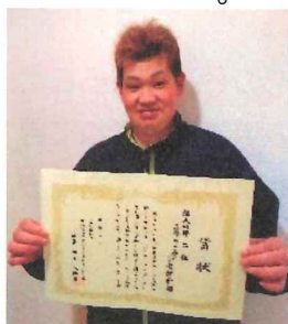
↑昨秋のボウリング大会みごと第二位！