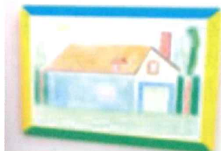
↑とっておきの芸術祭 出展作品 「アンパンマンのパン工場」