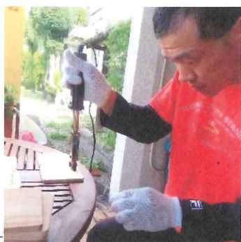
↑【木のコースター】焼き印作業の様子