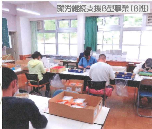
就労継続支援B型事業(B班)