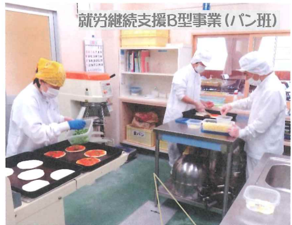
就労継続支援B型事業(パン班)